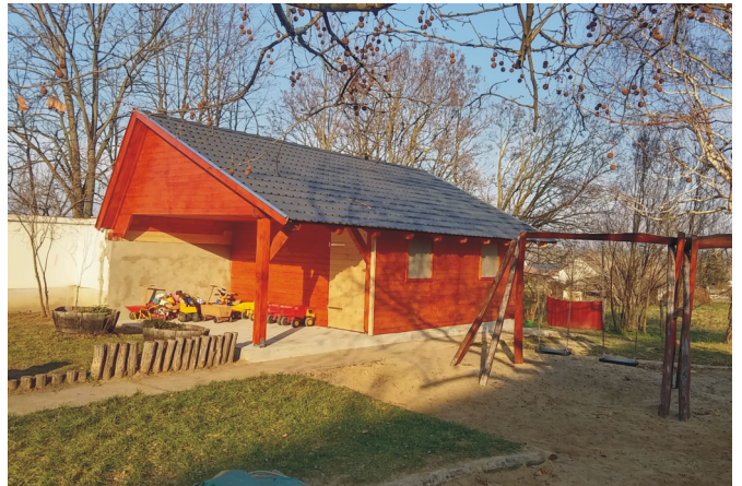
Új faház az óvoda udvarán