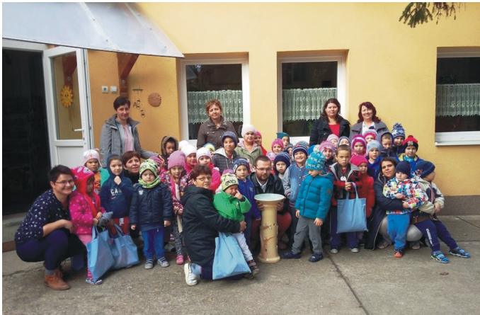
Egészségnap az oviban az új ivóközzel