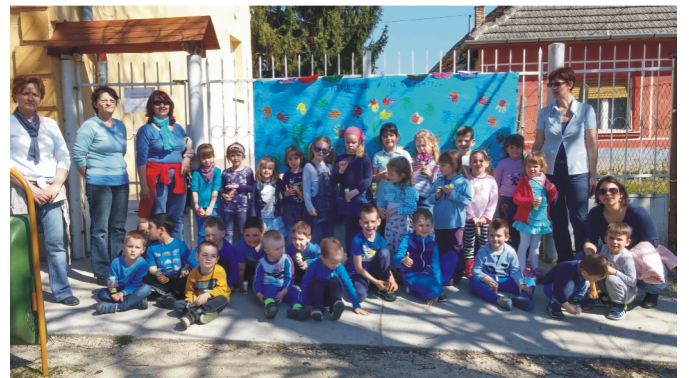
Víz Világnapja az oviban