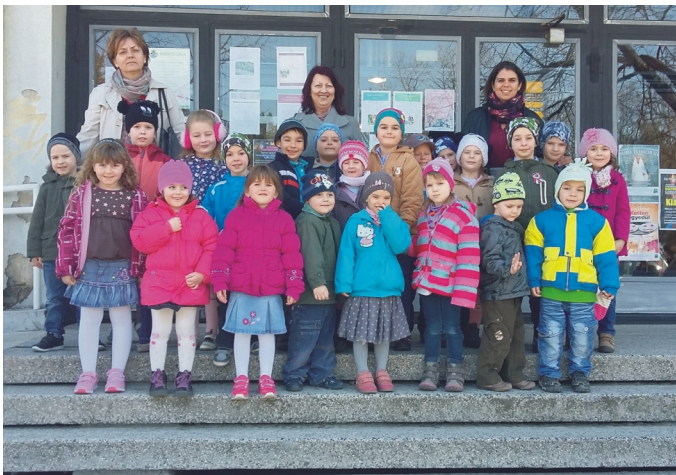
Az ovisok színházlátogatása